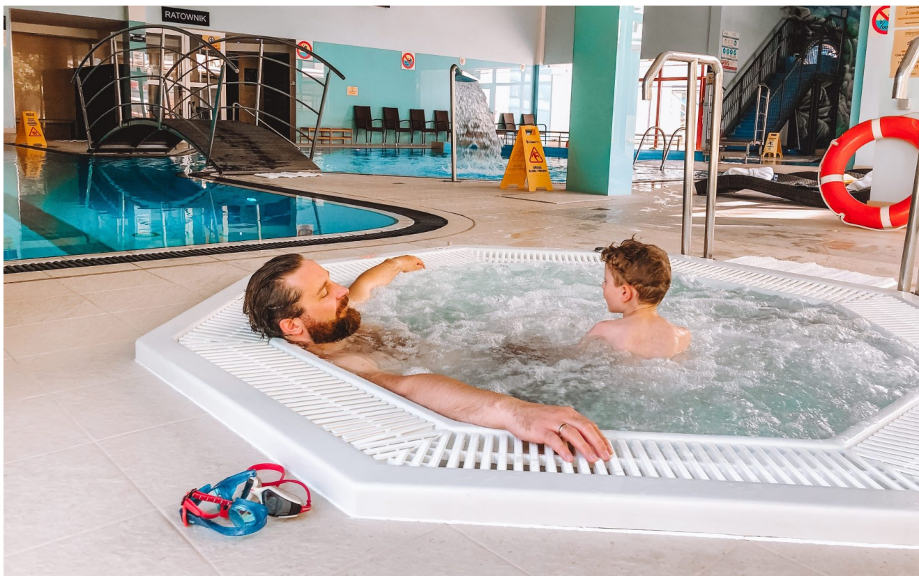
Basen wewnętrzny: jacuzzi, basen sportowy, strefa dla maluchów i zjeżdżalnia