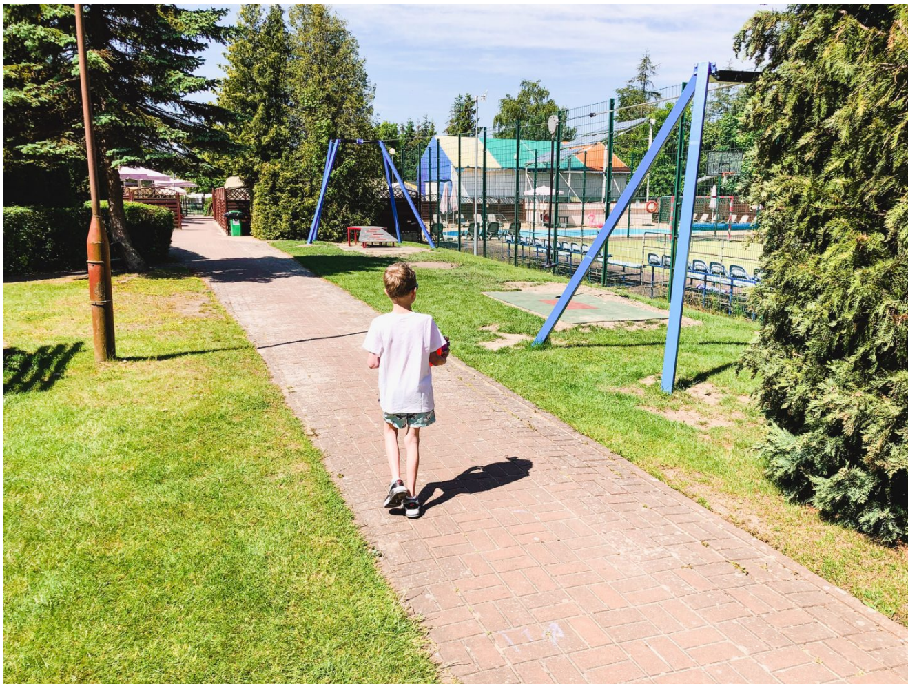
Po prawej boisko do tenisa i piłki nożnej, dalej baseny