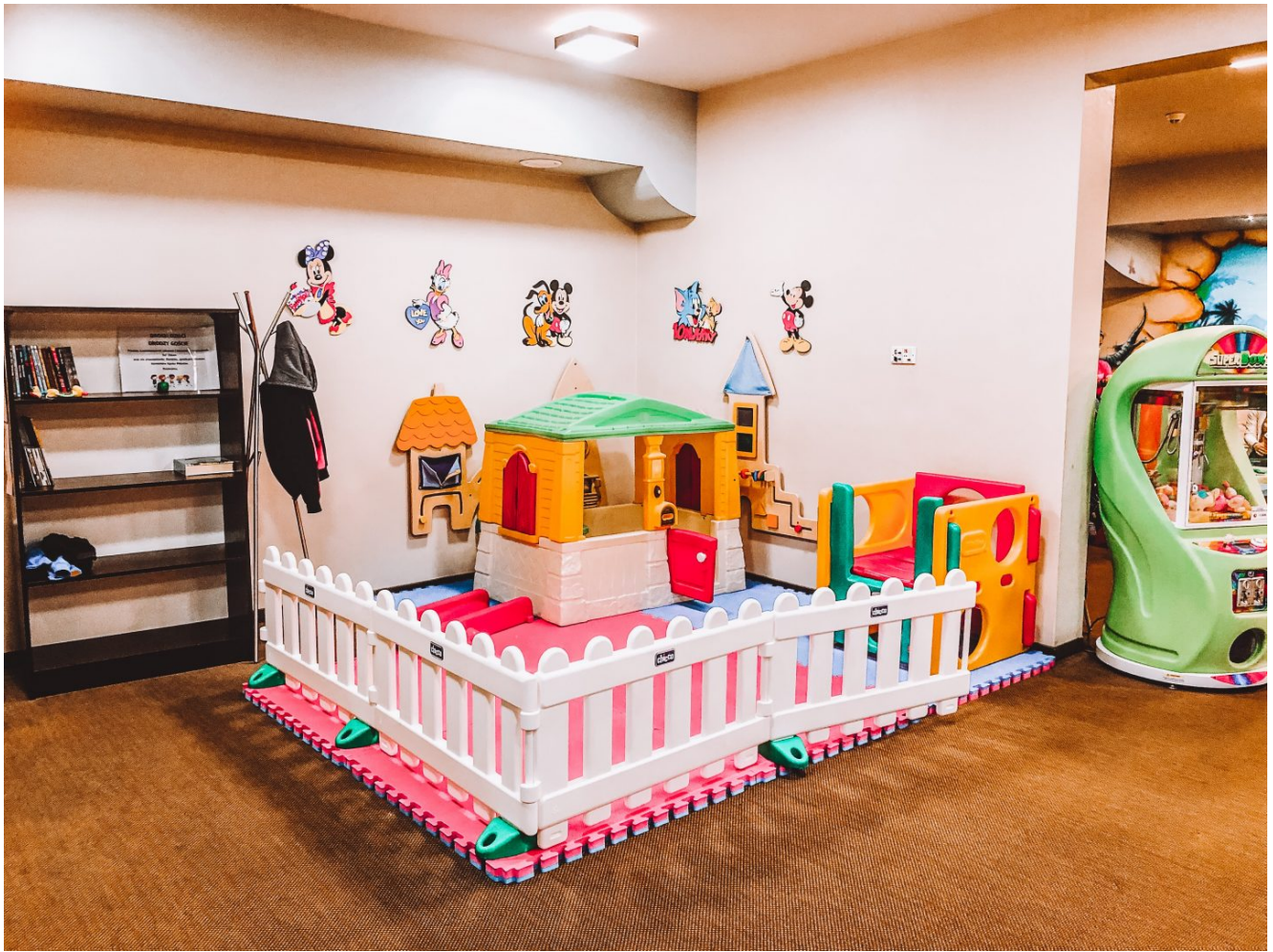
Sala zabaw dla dzieci