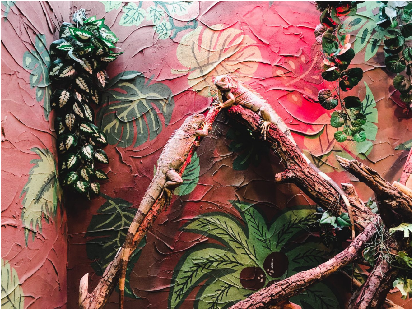
Cisi obserwatorzy dziecięcych zabaw □