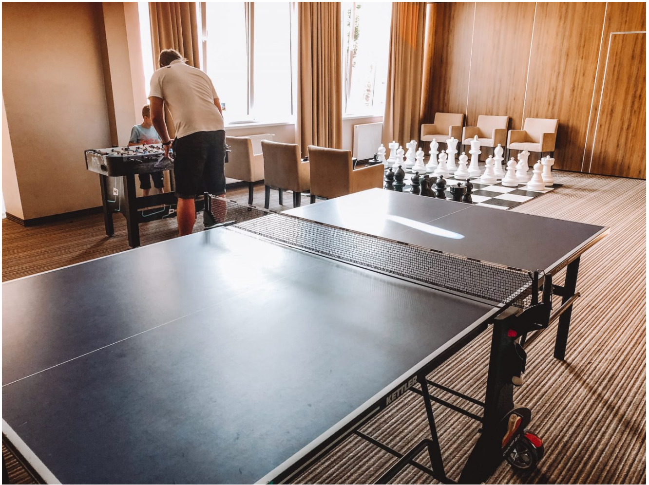
Sala gier obok sal konferencyjnych