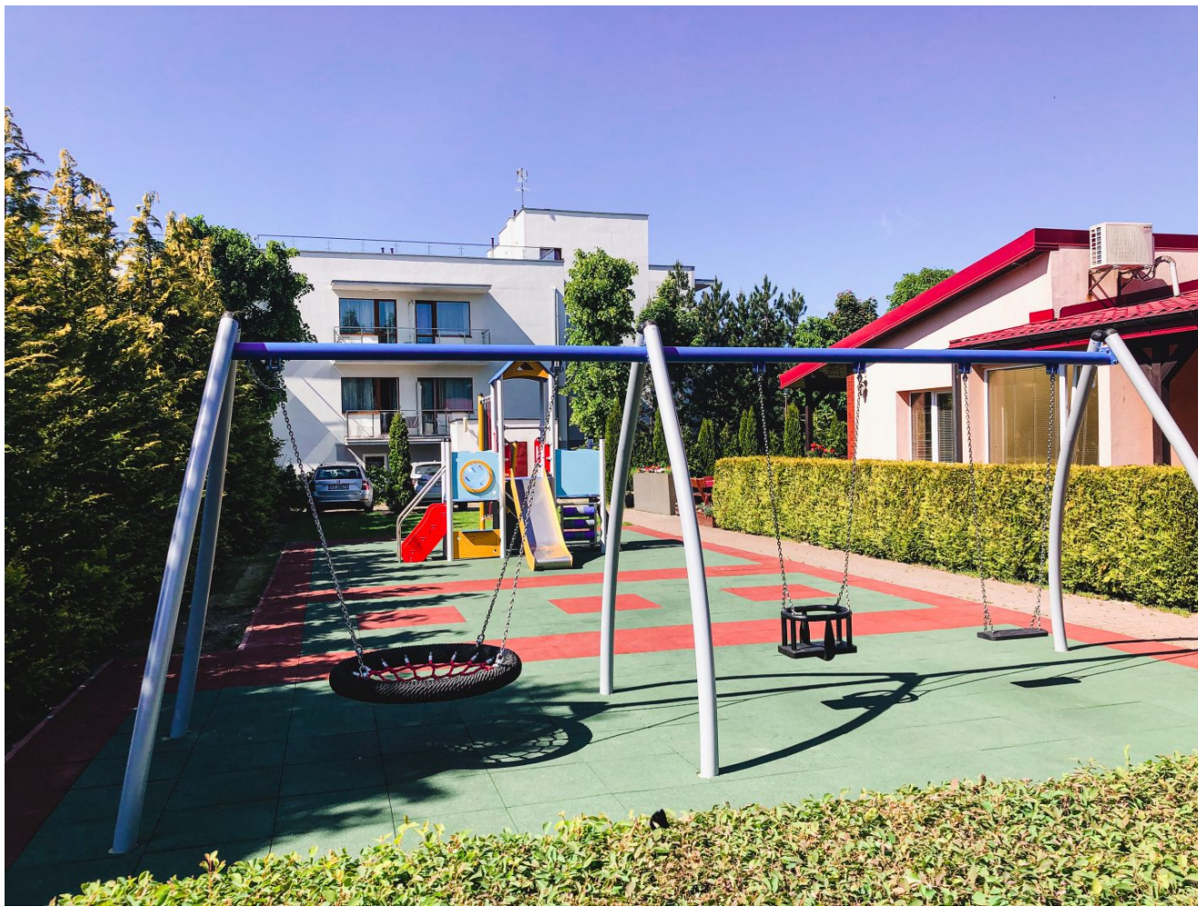
Pierwszy plac zabaw