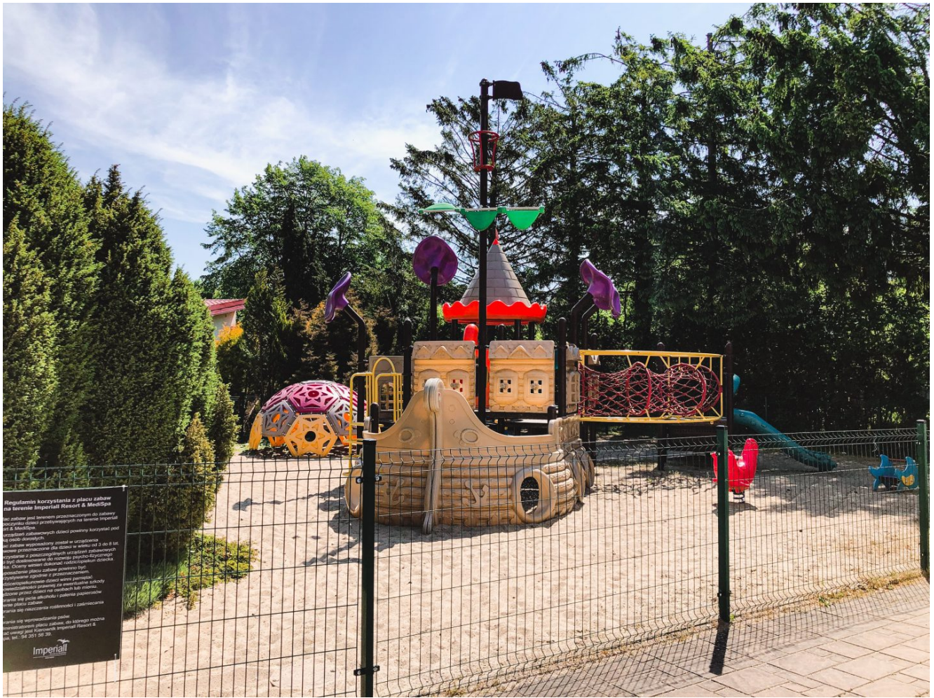
Drugi plac zabaw dla maluchów