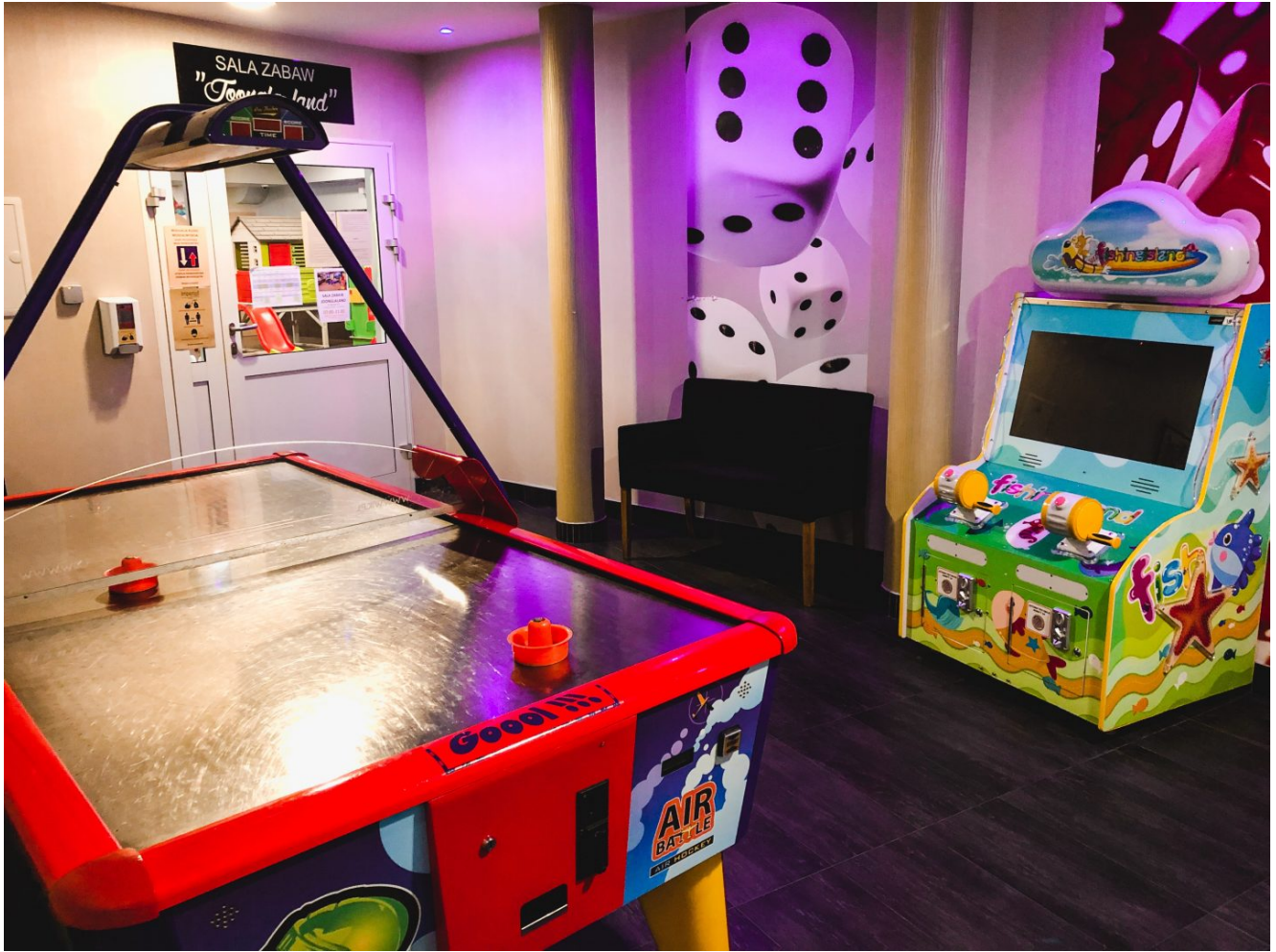
Automaty w hotelu